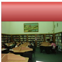
Ghidul bibliotecii Universității „Dunărea de Jos” din Galați 2013